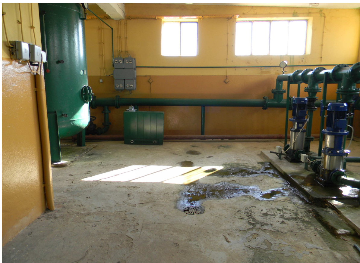
Stacja hydroforowa (pompy II stopnia i zbiorniki hydroforowe)