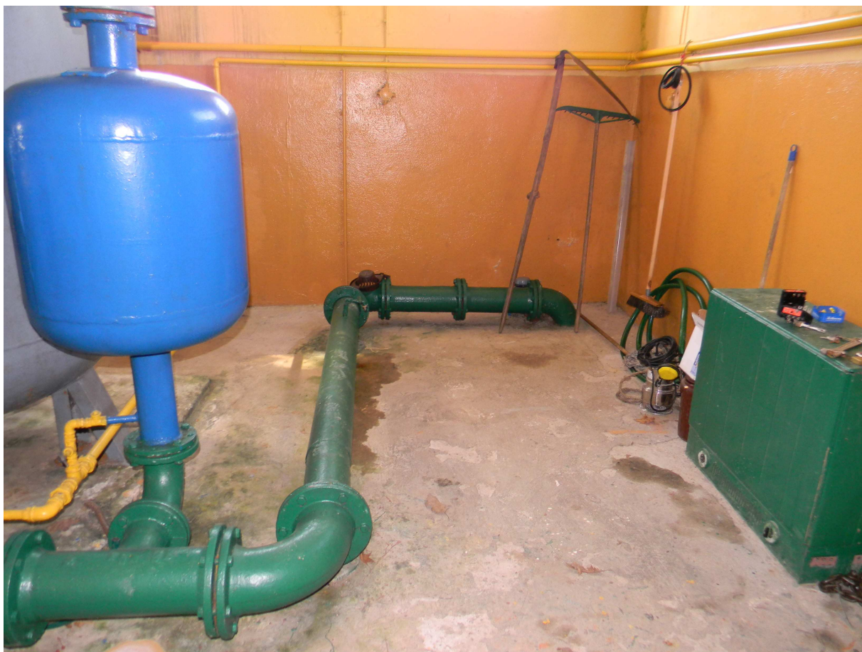
Rurociąg wody surowej ze studni