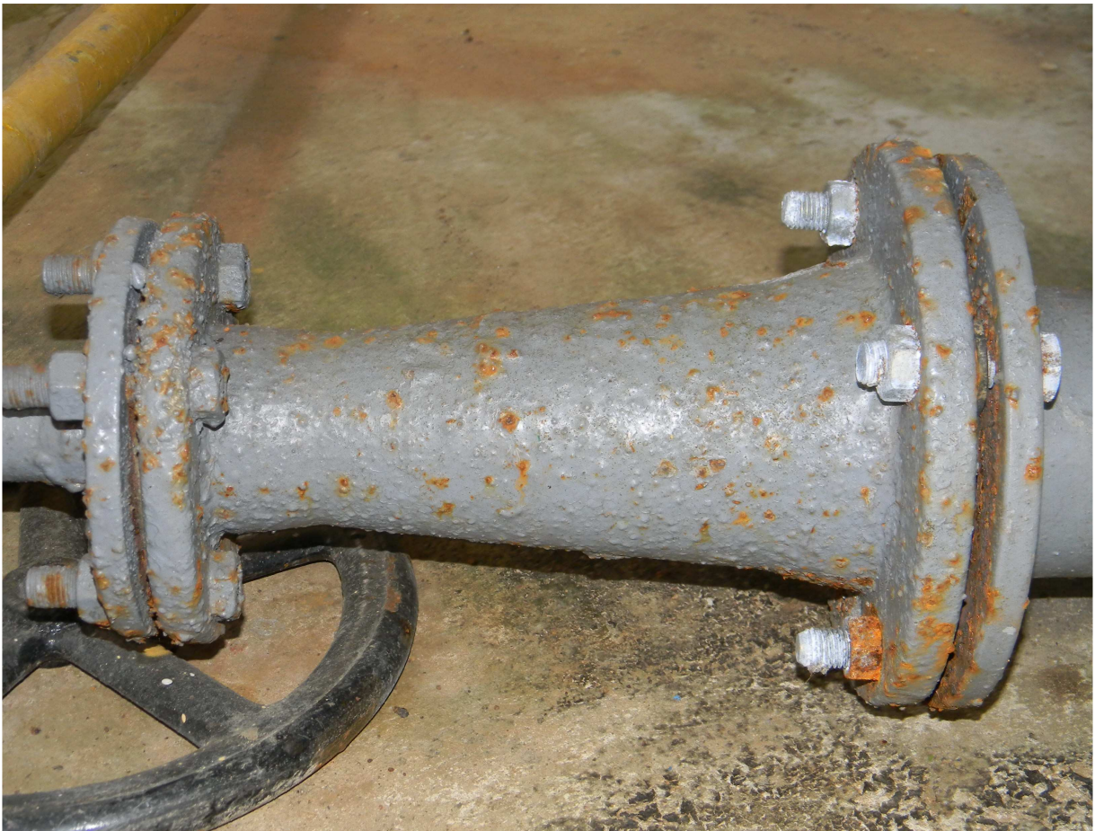
Skorodowane elementy rurowe i armatura