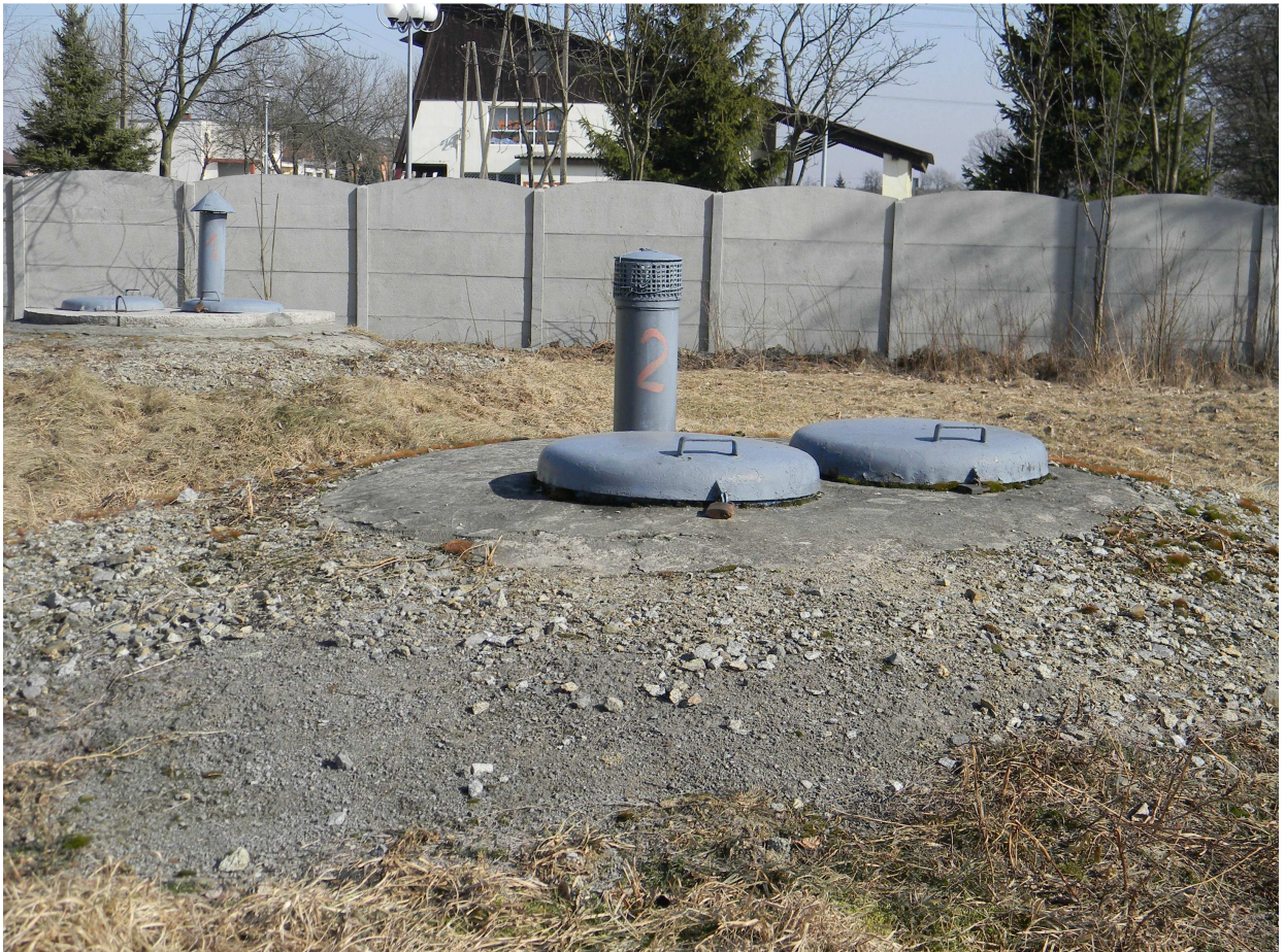
Istniejące studnie głębinowe 1 i 2