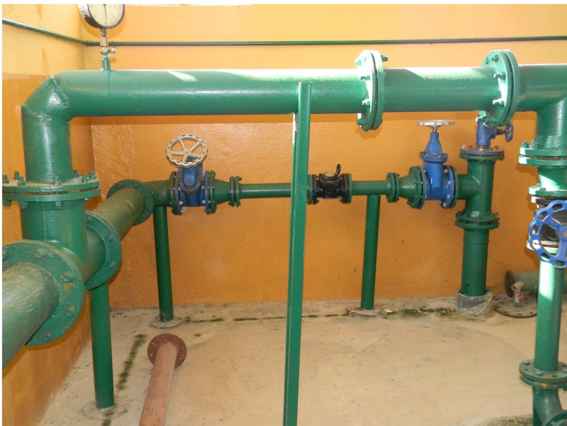
Rurociąg wody uzdatnionej do sieci wodociągowej