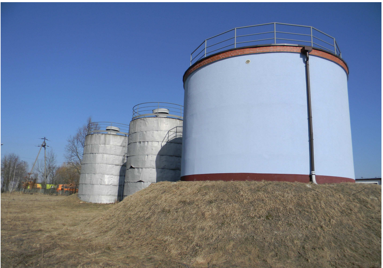
Istniejące zbiorniki wyrównawcze 2 x 100m 3 + 1 x 200m 3