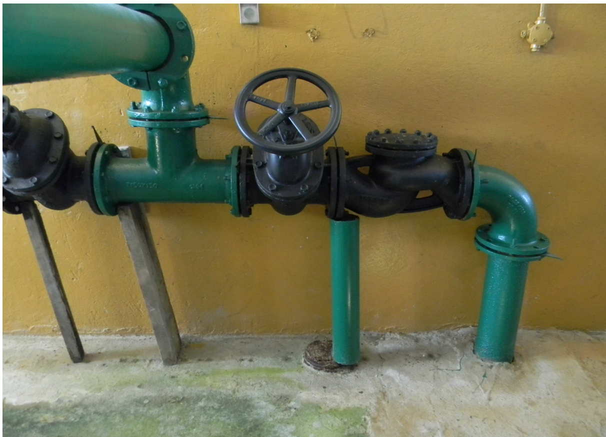
Rurociąg wody uzdatnionej z odźelaziaczy do zbiorników wyrównawczych