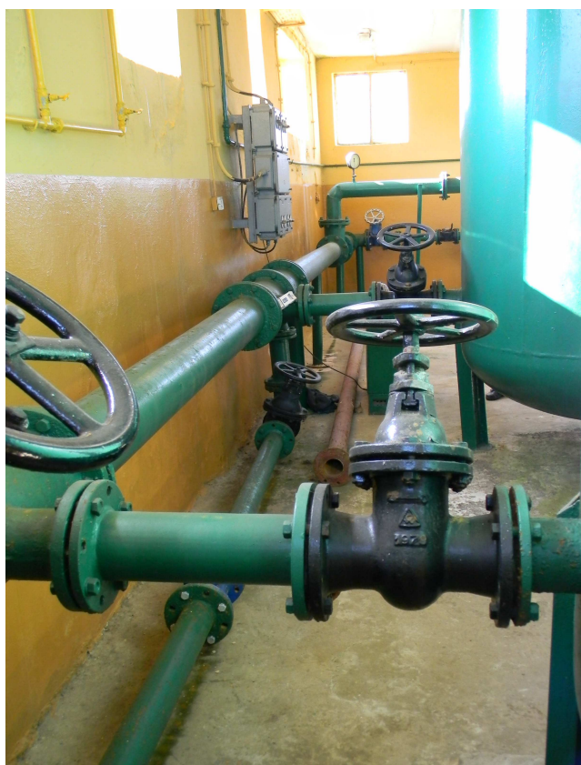
Fragmety połączeń rurowych zbiorników hydroforowych