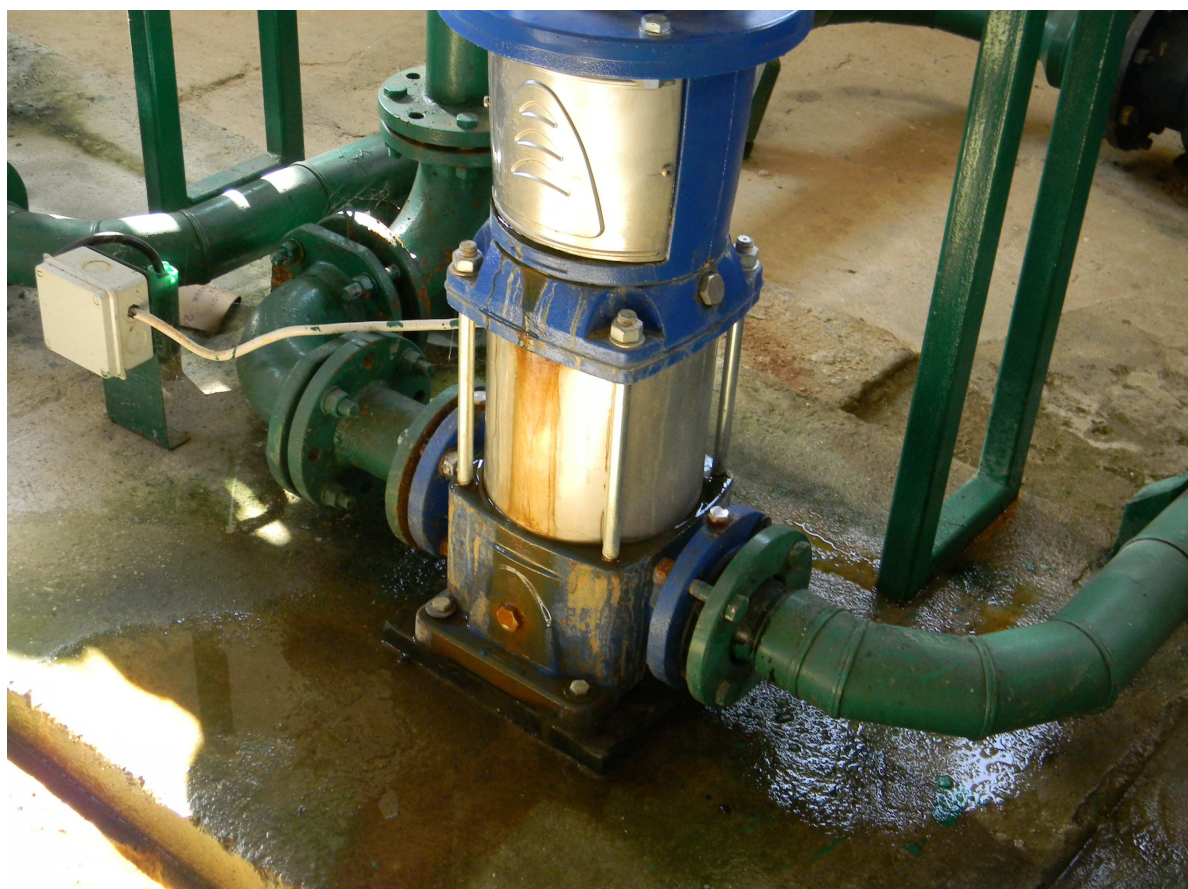
Pompy sieciowe II stopnia