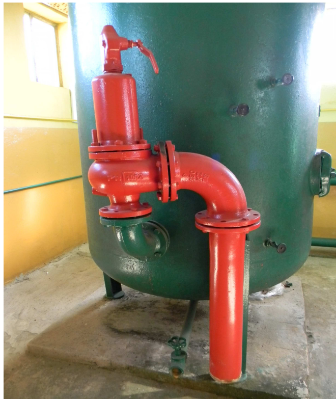
Zawór bezpieczeństwa przy zbiorniku hydroforowym