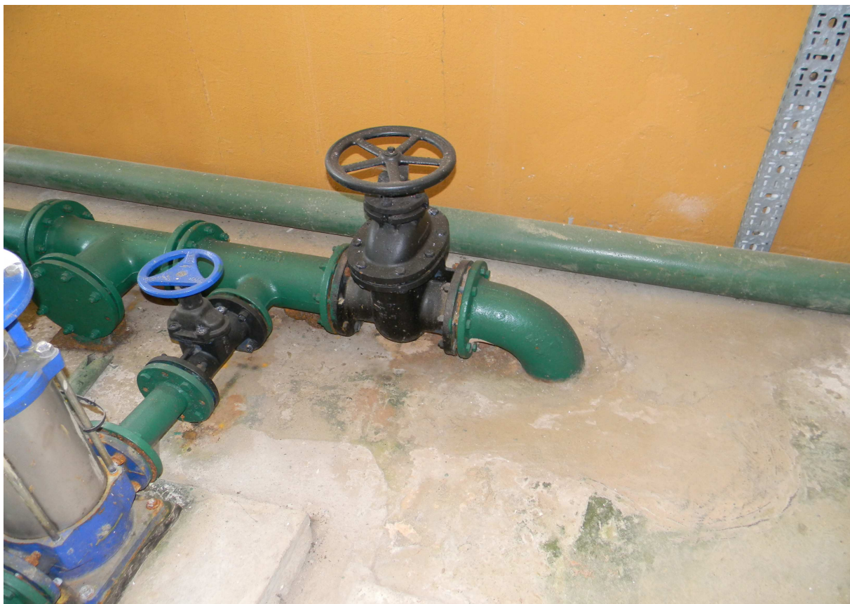
Rurociąg wody uzdatnionej ze zbiorników wyrównawczych do pomp II stopnia