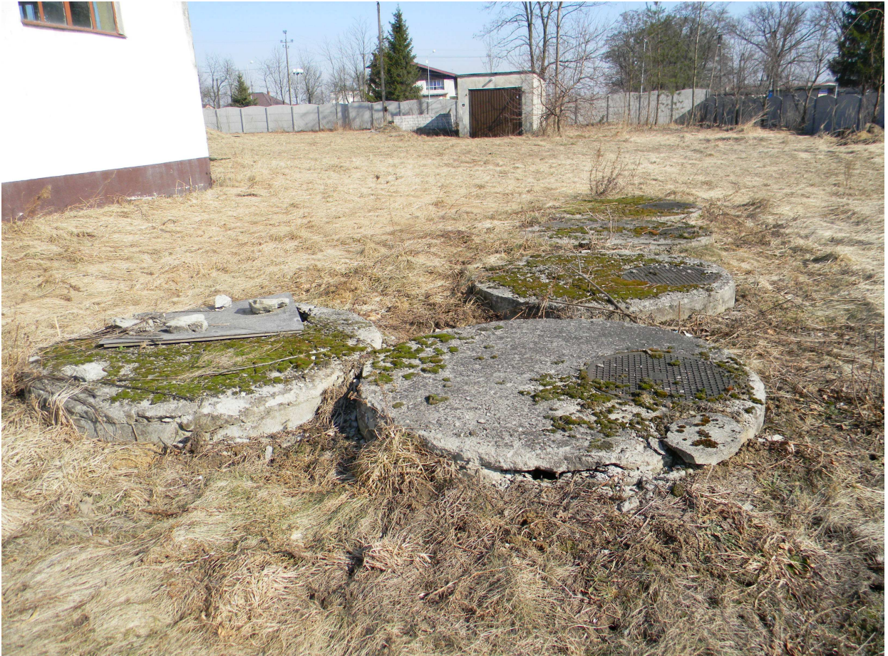
Istniejący odstojnik wód popłucznych