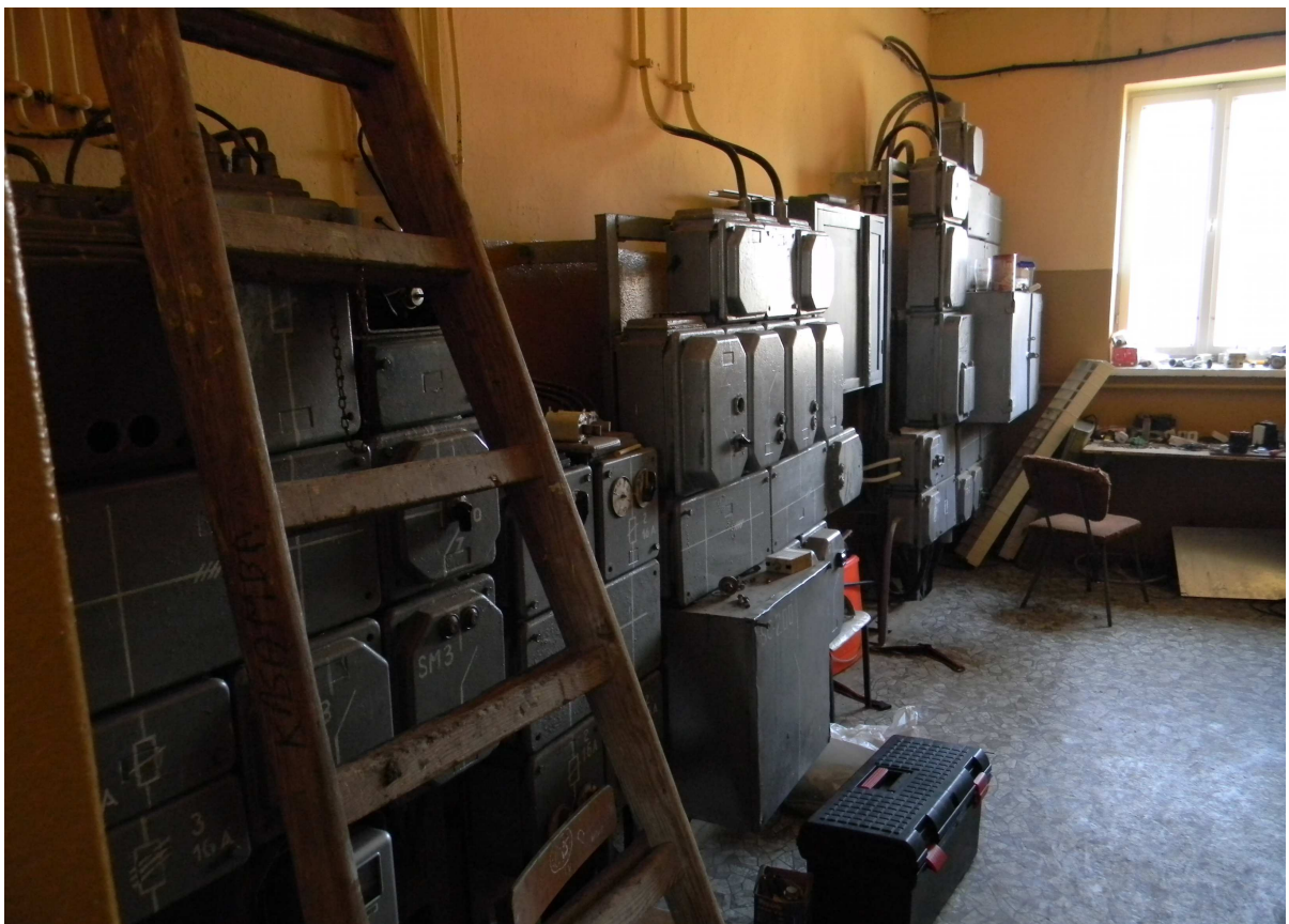
Dyspozytornia elektryczno - sterownicza