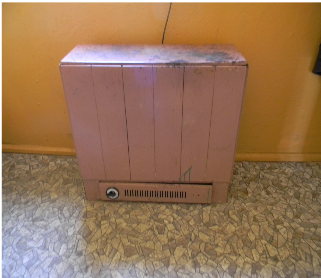
Grzejnik elektryczny akumulacyjny