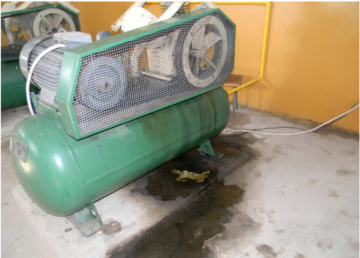
Agregaty sprężarkowe typu WAN - AW