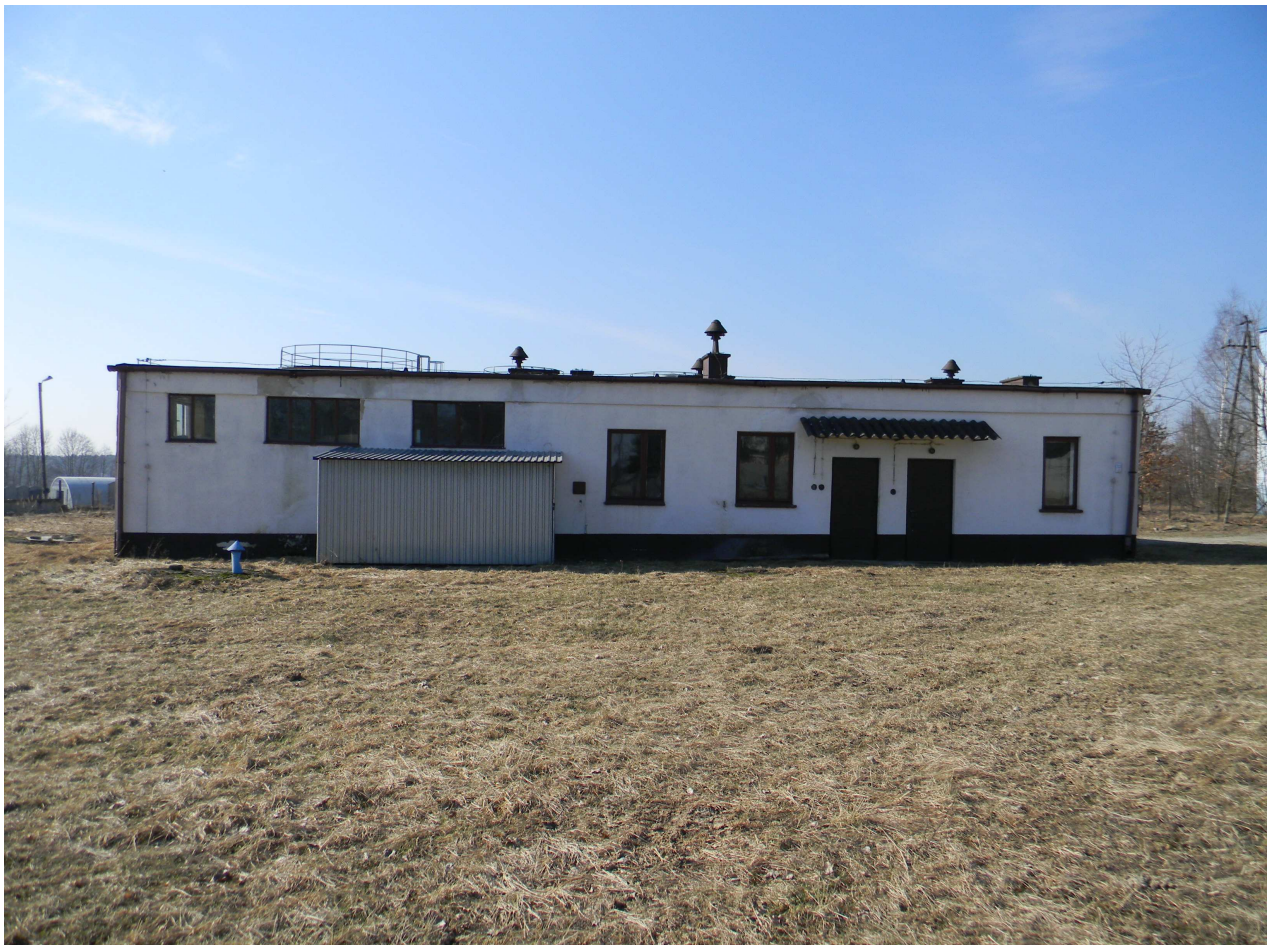
Istniejący budynek S.U.W.