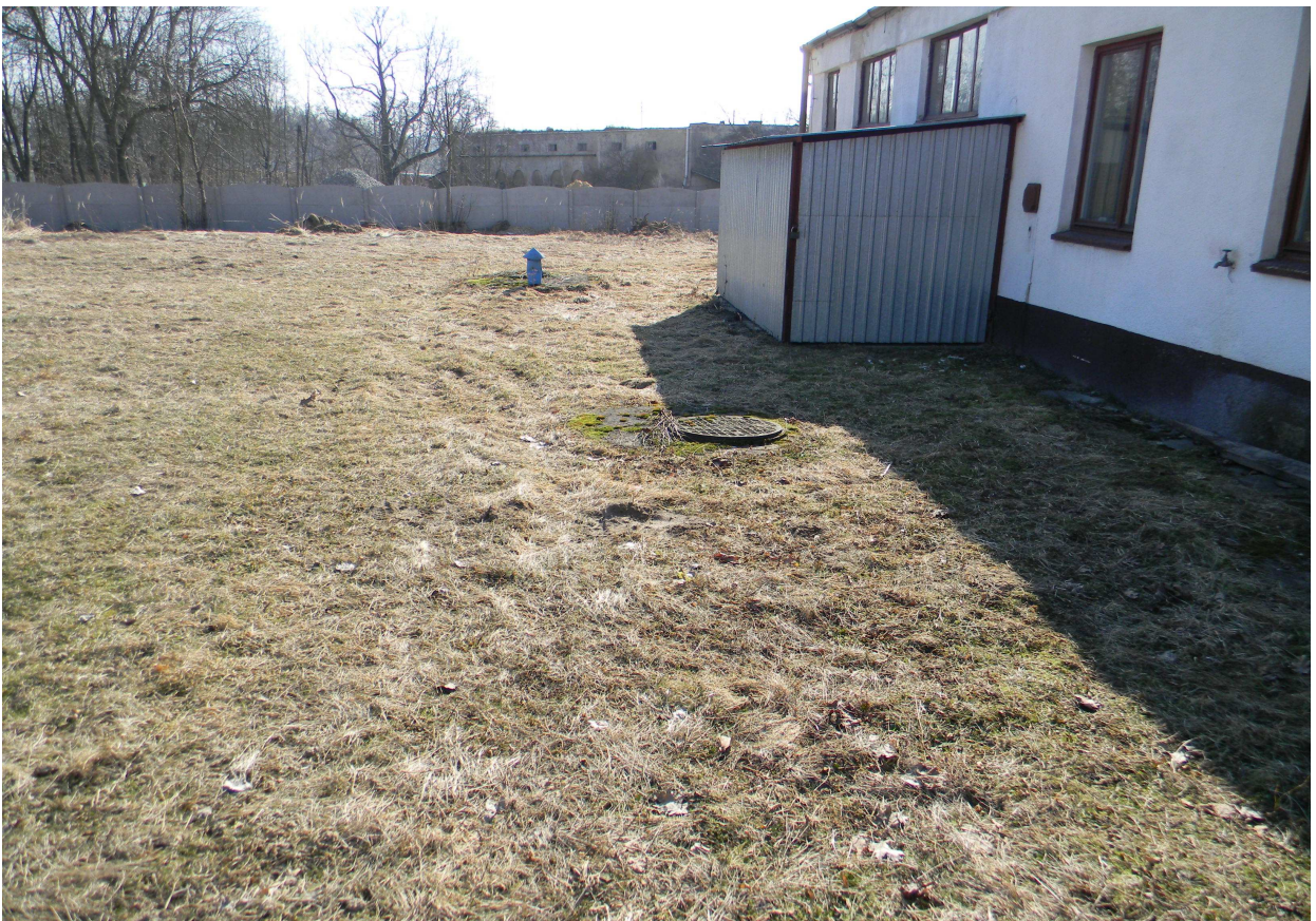
Istniejący osadnik ścieków szczelny