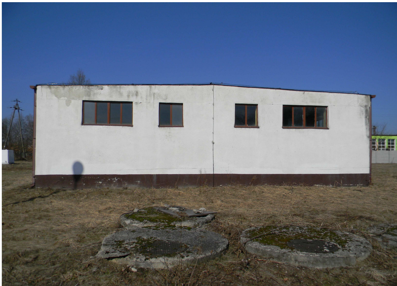
Istniejący budynek S.U.W.