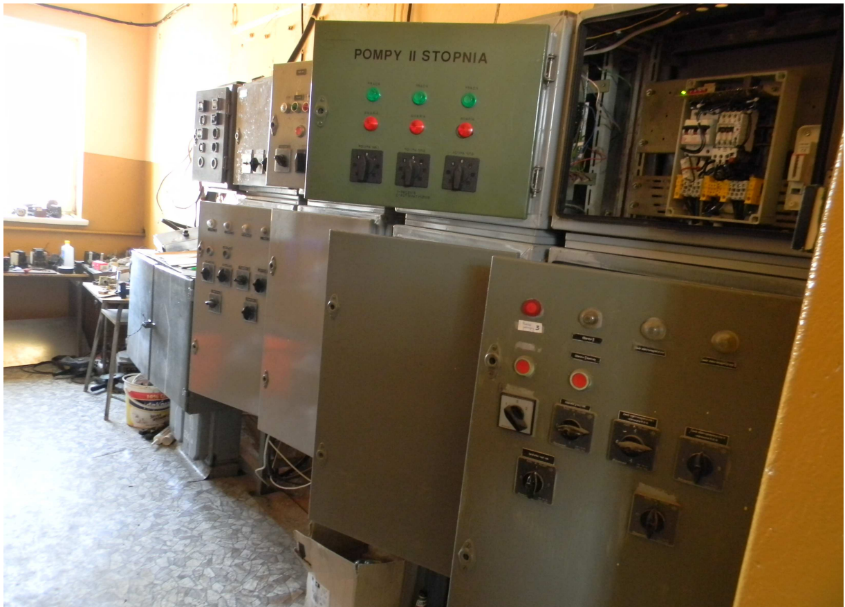
Dyspozytornia elektryczno - sterownicza