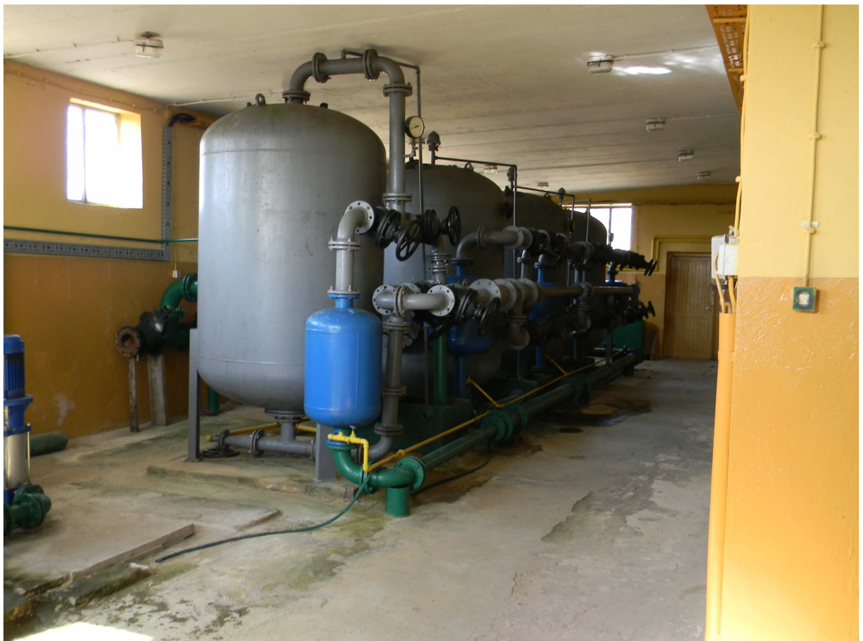
Istniejące odzłaziacze (zbiorniki filtracyjne i aeratory)