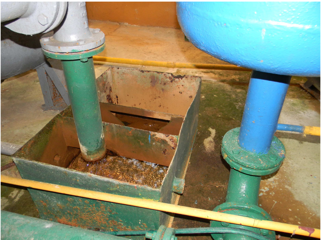
Fragmenty połączeń odżelaziaczy