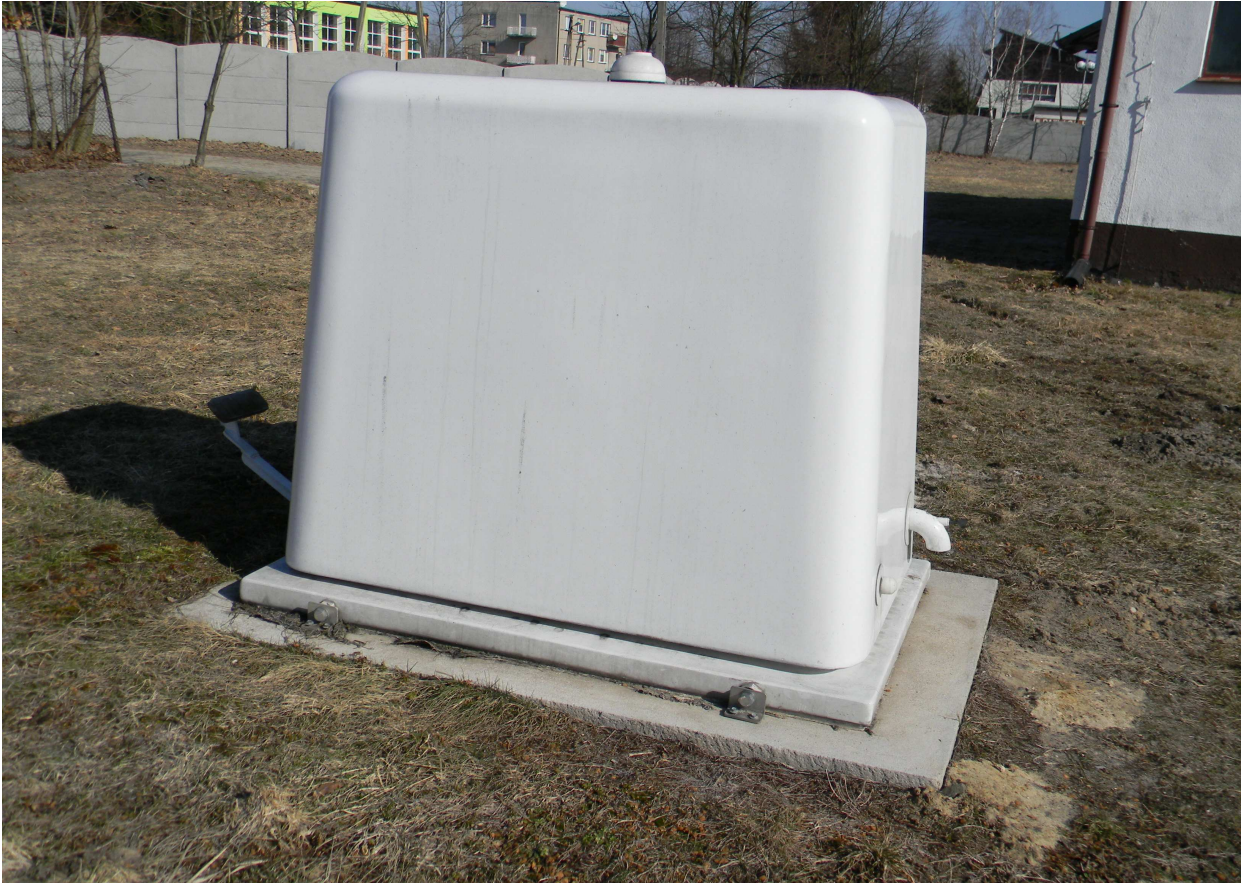
Istniejąca studnia głębinowa nr 3